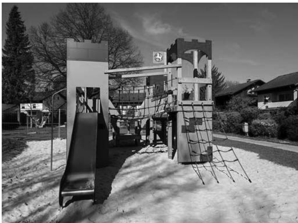
Spielplatz Waginger Straße – neue Spielburg

Sitzung Nr. 10 vom 4. Oktober 2022 - öffentlich -