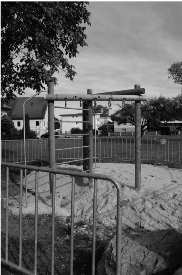
Spielplatz Petersweg – Kletterwald

Zur Auswahl standen ein Karussell, der Kletterwald und ein Bodentrampolin.