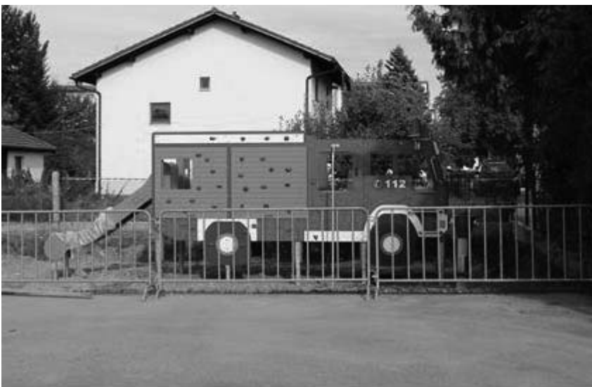
Spielplatz Ahornstraße – neues Multifunktionales Spielgerät – Feuerwehrauto Flori

Zur Auswahl standen die Schaukel, ein Wippgerät und eine Slackline.