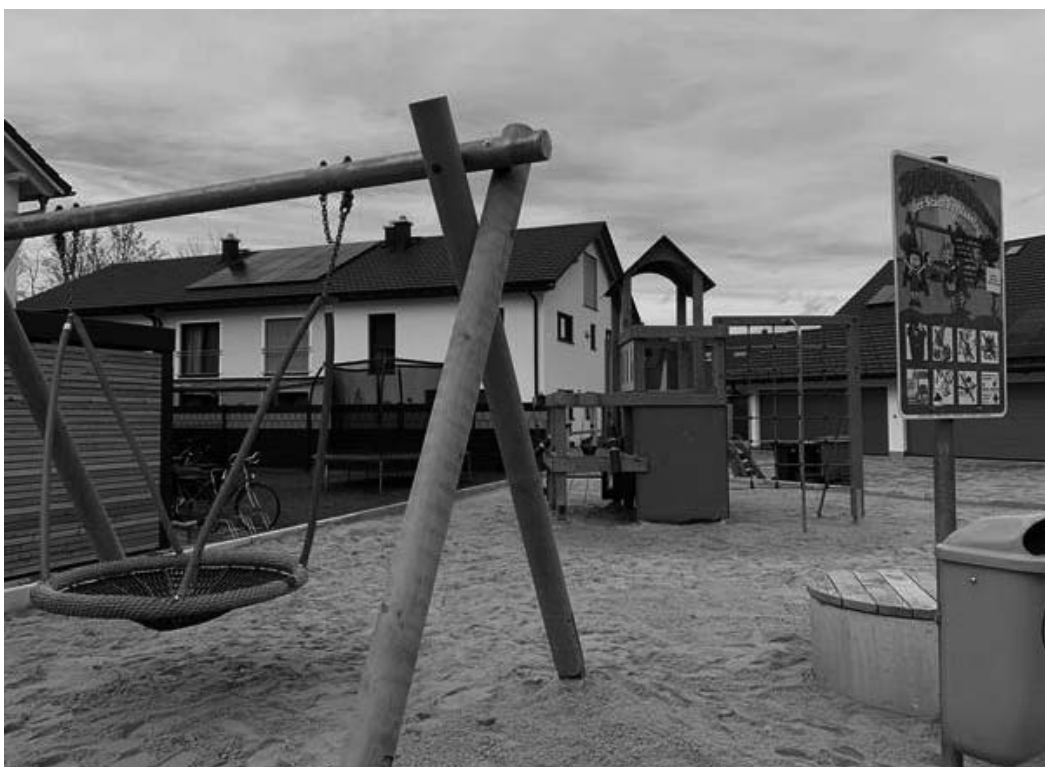
Spielplatz Pfarrerleitn – neuer Spielplatz mit Vogelnestschaukel und Klettergerüst