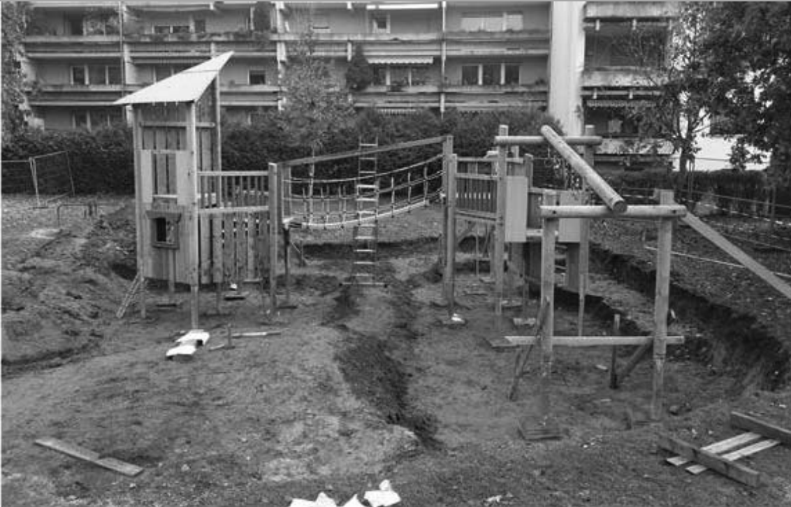
Spielplatz im Eichetpark – Errichtung Klettergerät 2021

Sitzung Nr. 10 vom 4. Oktober 2022 - öffentlich -