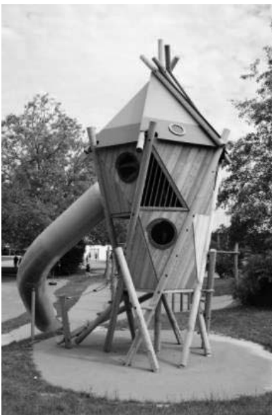
Spielplatz am Heideweg – Ruschturm Pilastro (Ersatzmaßnahme Rutsche)