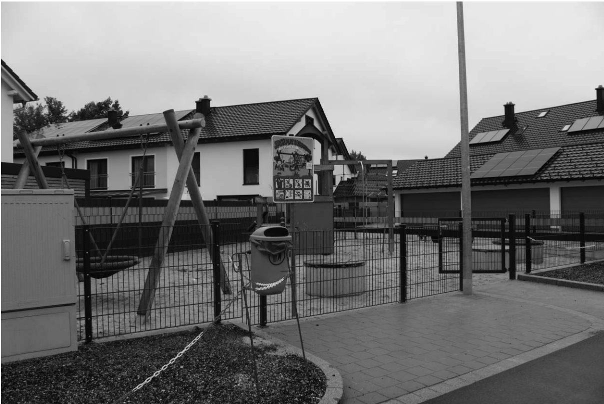
Spielplatz Pfarrerleitn – Zaun

Der neue Zaun wurde errichtet, sodass jetzt die Kinder vor Gefahrenquellen geschützt sind.