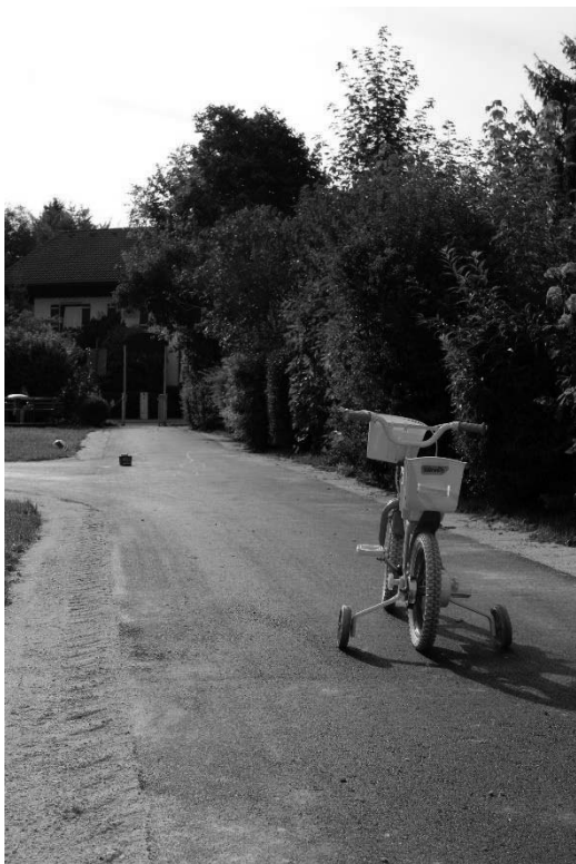
Spielplatz Waginger Straße – neu asphaltierter Weg

Zusätzlich wurde dieses Jahr im Zuge des Straßenunterhalts beim Spielplatz in der Waginger Straße der Asphaltweg neu gemacht. Jetzt kann der Weg wieder optimal befahren und bespielt werden.