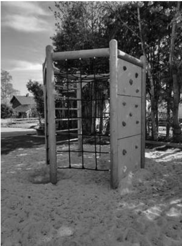
Spielplatz Ahornstraße – neuer Kletterturm