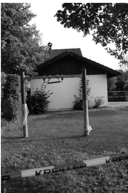
Spielplatz Ahornstraße – Schaukel