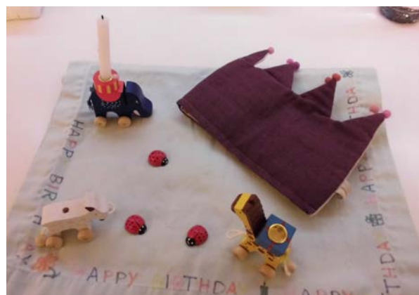
Deko - Geburtstagstisch + Krone