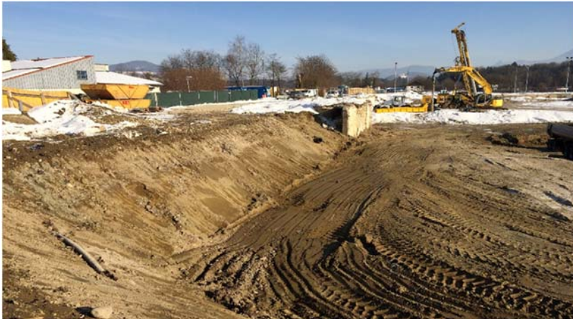
Bild 3: Gründungs- und Erdarbeiten im Bereich der alten Sporthalle

3,5 Meter höher liegt als das „alte Badylon“ wurden rund 1.100 Rüttelstopfsäulen zur Baugrundverbesserung eingebracht und rund 13.000 m 3 Verfüllmaterial eingebaut.