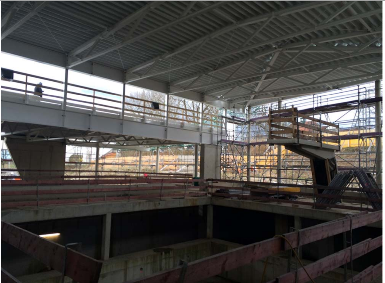
Bild 6: Springerbecken mit 3-Meter Sprungturm. Im April 2018 waren die Arbeiten am Dachtragwerk weitestgehend abgeschlossen

Ab Anfang Oktober 2018 wurden im Innenbereich der Schwimmhalle die Edelstahlbecken montiert. Das Sportbecken, das Sprungbecken und das Lehrschwimmbecken werden aus Edelstahl angefertigt. Das Planschwimmbecken für die Kleinkinder wird aufgrund der vielen Rundungen gefliest. Ende 2018 waren rund 20 Firmen zeitgleich auf der Baustelle. Es wurde sowohl an der Technik (Rohrleitungen, Lüftungsgeräte, Kanäle, Schaltschränke, usw.) als auch im Innenausbau (Estrich, Putz, Trennvorhänge, Fliesenarbeiten, usw.) gearbeitet.