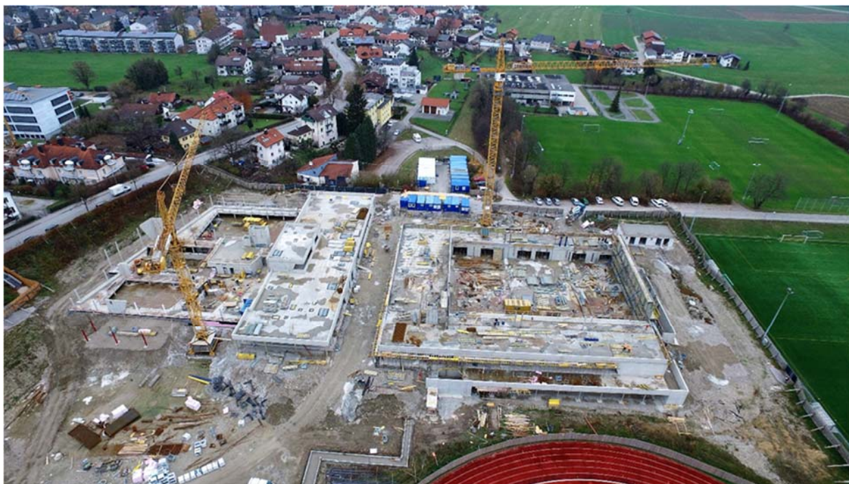
Bild 5: Aufnahme mit der Drohne im November 2017, Im Erdgeschoss der Schwimmhalle (links) und der Sporthalle (rechts) sind die Außenwände größtenteils betoniert