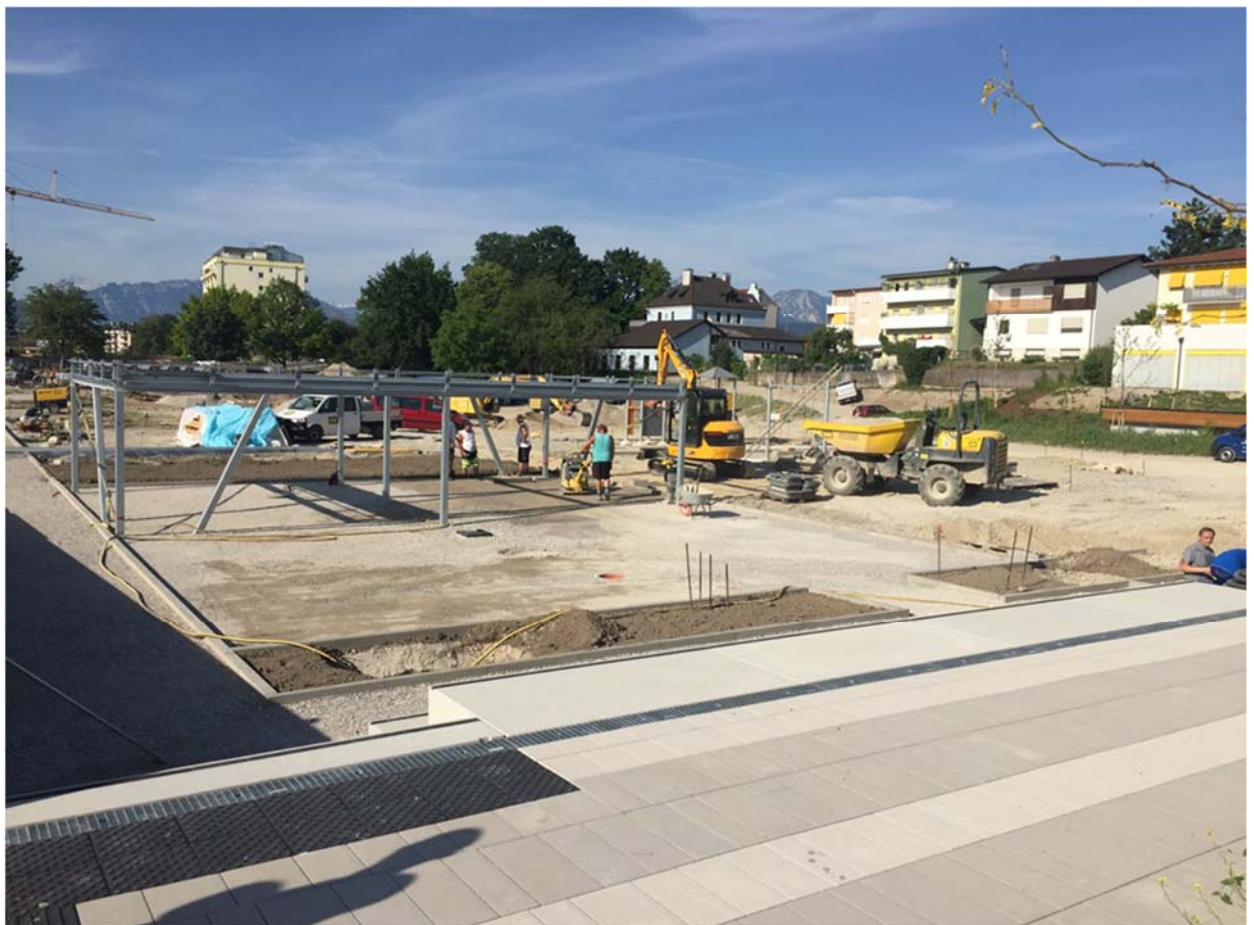
Bild 14: Mitte Juni 2019 liefen die Arbeiten an den Außenanlagen auf Hochtouren

In der Sporthalle wurde bereits ab Mitte Februar mit den Malerarbeiten begonnen. Im Bereich der Sporthallenfläche waren bis Ende März die Prallwände soweit verbaut, dass ab Anfang April der Sportboden verlegt werden konnte. Bis Mitte Juli waren die Arbeiten an den Gebäuden soweit abgeschlossen, dass ein erster Probetrieb gestartet werden konnte. Die Außenanlagen konnten bis Ende August soweit fertiggestellt werden, dass der Eröffnung am 14.09.2019 nichts im Wege stand.