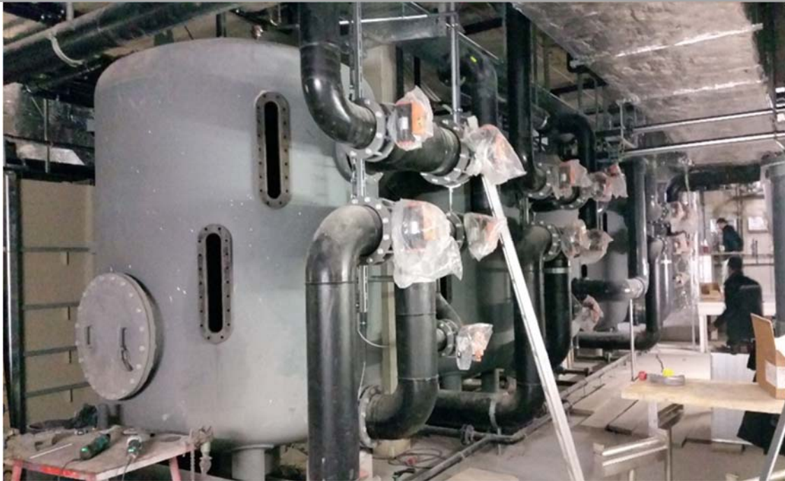
Bild 7: Im Technikeller der Schwimmhalle werden die Leitungen für die Badewassertechnik montiert. Die großen Filterbehälter wurden bereits im Rohbau eingebracht