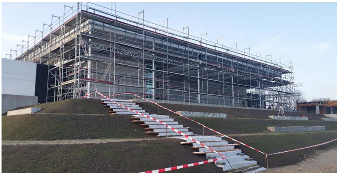
Bild 8: An den Außenanlagen wurden Ende 2018 die Stufen und Sitzelemente der Naturtribüne im Bereich der Sporthalle erstellt