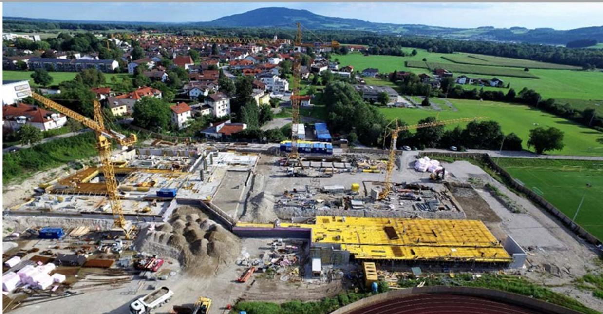
Bild 4: Aufnahme mit der Drohne im August 2017, die Rohbauarbeiten sind im vollen Gange

Sitzung Nr. 10 vom 24. November 2020 - öffentlich -