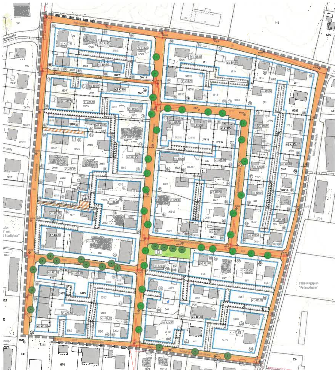
Bebauungsplanentwurf ohne Maßstab

Der Geltungsbereich des Bebauungsplans beinhaltet einen Teilbereich des Bebauungs- und Baulinienplans „Mitterfeld“ mit „Kirch- und Stadtplatz“. Dieser wird von der Matulus-, Martin-Luther-, Wolfgang-Hagenauer-, Fröbel- und Vinzentiusstraße begrenzt. Er beinhaltet die Baugrundstücke Fl.Nrn. 379, 379/6, 379/3, 379/4, 380/13, 380/2, 380/6, 380/5, 380/16, 380/7, 380/8, 380/3, 397/1, 377/2, 399/3, 399/5, 400/2, 400/3, 401/2, 368/2, 368/7, 299, 299/12, 368/3, 368/5, 367/1, 401/15, 401/14, 401/13, 401/12, 401/5, 400/4, 399/6, 398/10, 398/3, 398/5, 398/8, 398/4, 398/19, 397/3, 339, 339/5, 339/4, 339/2, 338/2, 337/2, 336/2, 336/5, 336/3, 337, 338/3, 381/3, 381, 381/4, 381/7, 381/2, 381/1, 380/12, 378, 377/4, 376/2, 399/10, 364/2, 363, 361/5, 361/4, 363/2, 364, 376/3, 377/16, 377/15, 377/6, 380, 381/6, 381/8, 380/15, 380/10, 380/11, 377/9, 377/10, 377/11, 377/12, 377/13, 377, 376, 399, 364/1, 363/1, 362/1, 361/6, 361/3, 361/2, 399/13, 399/4, 399/14, 398/9, 398/18, 83/8, 83/7, 83/6, 83/5, 359/3, 359/4, 338/4, 341/3, 341, 341/2, 340/1, 340, 339/3, 83/2, 83/4 sowie weitere Grundstücke Fl.Nrn. 58 (Teilfläche), 375 (Teilfläche), 366/4 (Teilfläche), 332/8 (Teilfläche), 330 (Teilfläche), 365 (Teilfläche), 380/4, 377/7, 83/9, 339/6, 366/2, 397/2 und 398/17 der Gemarkung Freilassing) und ist aus dem nachstehenden Lageplan (ohne Maßstab) ersichtlich.