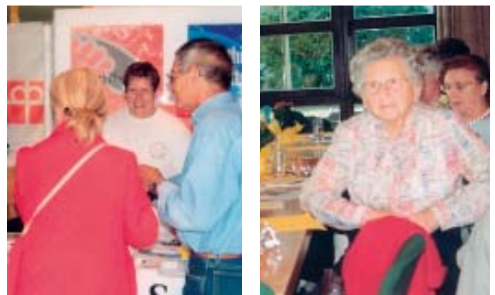
Gut besucht wie in den vergangenen Jahren war auch heuer wieder der „ Tag der Senioren “ am 27. September im Rathaus. Nicht nur das gesellige Beisammensein stand im Vordergrund; die Besucher hatten auch Gelegenheit sich an Info-Ständen über das Angebot von verschiedensten sozialen Organisationen zu erkundigen.