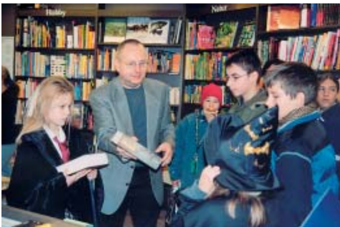
Am 8. November grassierte auch in Freilassing das Harry-Potter-Fieber .