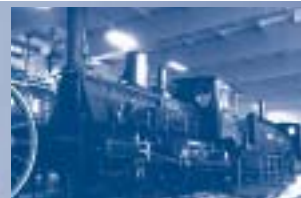
Die Dampflok B IX kommt nach Freilassing