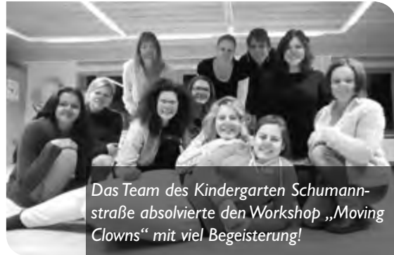
Das Team des Kindergarten Schumannstraße absolvierte den Workshop „Moving Clowns“ mit viel Begeisterung!

dergartens Schumannstraße wählte diesen Workshop ganz bewusst – mit dem Ziel die eigene Achtsamkeit zu vertiefen, zu entschleunigen und auch um einfach Freude zu haben! Die heutige Gesellschaft verlangt von jedem Einzelnen immer mehr Leistung, Perfektion, Schnelligkeit und vieles mehr. Das ist im Kindergartenalltag mit all seinen Anforderungen auf den verschiedensten Ebenen nicht anders und fängt schon bei unseren Kindern an.