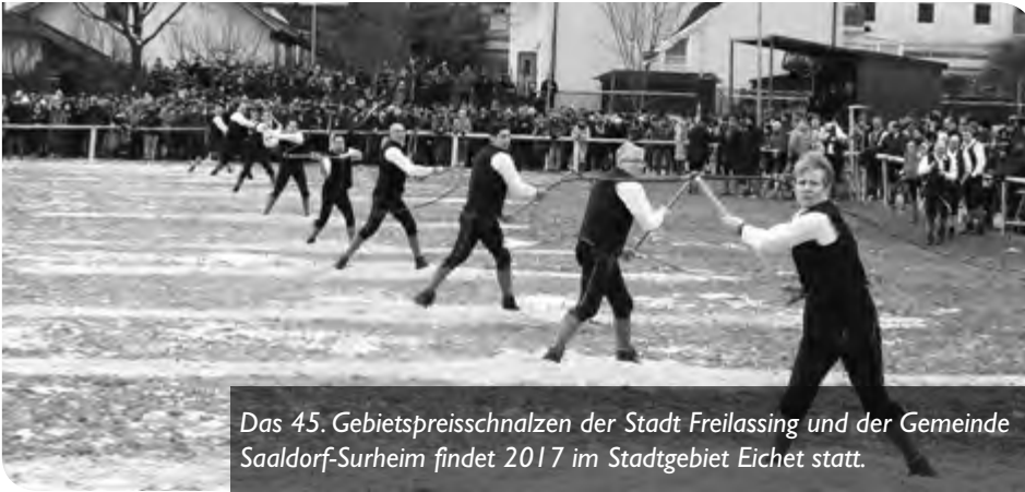
Das 45. Gebietspreisschnalzen der Stadt Freilassing und der Gemeinde Saaldorf-Surheim findet 2017 im Stadtgebiet Eicht statt.

Die Schnalzer aus Eicht freuen sich, das 45. Gebietspreisschnalzen der Stadt Freilassing und der Gemeinde Saaldorf-Surheim am 22. Januar 2017 erstmals in Eicht beim „Metzgerbauern“ in Freilassing ausrichten zu dürfen. Sie möchten alle Bürgerinnen und Bürger recht herzlich einladen, zu diesem besonderen Ereignis an die Schnalzerwiese und im Anschluss ins Feuerwehrhaus nach Freilassing zu kommen und mitzufiebern.