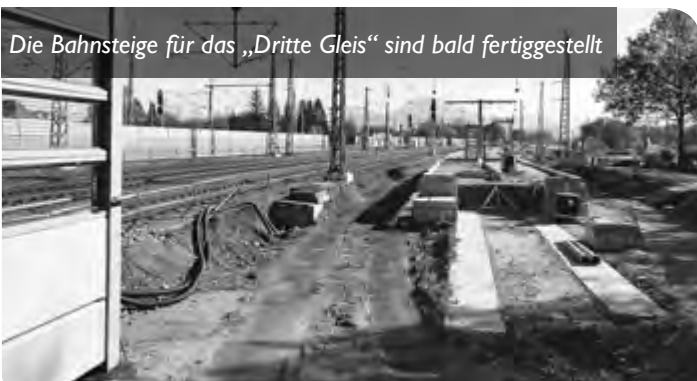
Die Bahnsteige für das „Dritte Gleis“ sind bald fertiggestellt

Im Gespräch mit Stefan Kreibich, DB-Projektleiter für den Bahn- hof Freilassing, wurde gleich zu Beginn deutlich, dass die Deut- sche Bahn in der jetzigen Planungsphase die Verkehrsstation in den Fokus stellt. Das heißt: barrierefreie Erreichbarkeit der Bahn- steige und der Züge und allgemeine Modernisierungsmaßnahmen. Wo möglicherweise ein neues Bahnhofsgebäude später station- niert werden soll ist im Moment zweitrangig. Vier Varianten konn- te Kreibich im Besprechungszimmer der DB Station & Service in München vorstellen. „Alle Varianten zeigen verschiedene Syner- gien, stellen aber vielleicht auch das ein oder andere Problem dar.“ so der Projektleiter. „Die DB müsse sich für die wirtschaftlichste Variante entscheiden. Wünsche der Stadt, die mit Mehrkosten ver- bunden sind, gehen zu Lasten der Stadtkasse“ ließ sich Bürger- meister Flatscher bestätigen. Allerdings entspricht keine der vor- gestellten Varianten in Gänze dem vom Stadtrat beschlossenen Rahmenplan. Der Stadtrat wird sich in einigen Monaten für eine Variante entscheiden.