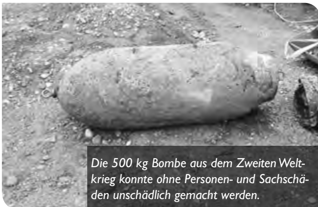
Die 500 kg Bombe aus dem Zweiten Weltkrieg konnte ohne Personen- und Sachschäden unschädlich gemacht werden.

Anfang Oktober wurde bei Grabungsarbeiten im Industriegebiet Nord eine 500 kg Fliegerbombe aus dem zweiten Weltkrieg gefunden. Spezialisten aus München