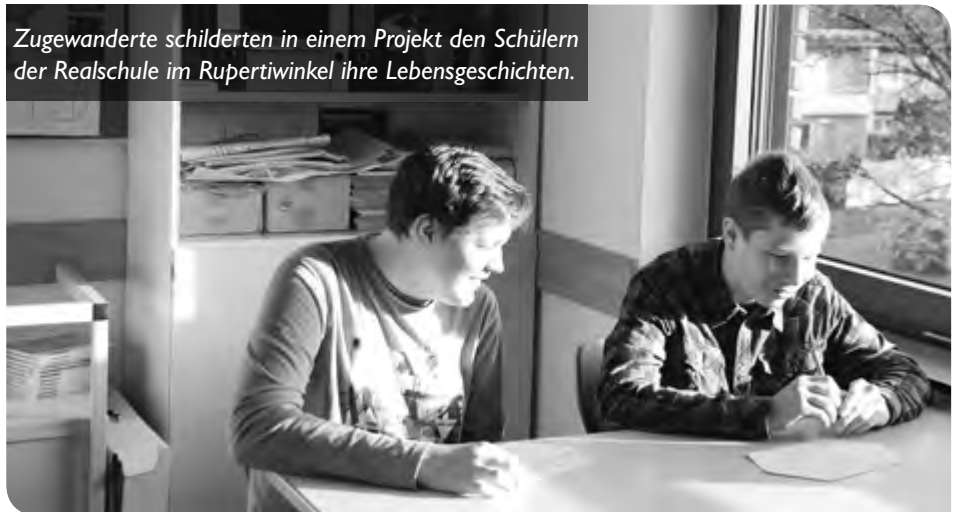
Zugewanderte schilderten in einem Projekt den Schülern der Realschule im Rupertiwinkel ihre Lebensgeschichten.