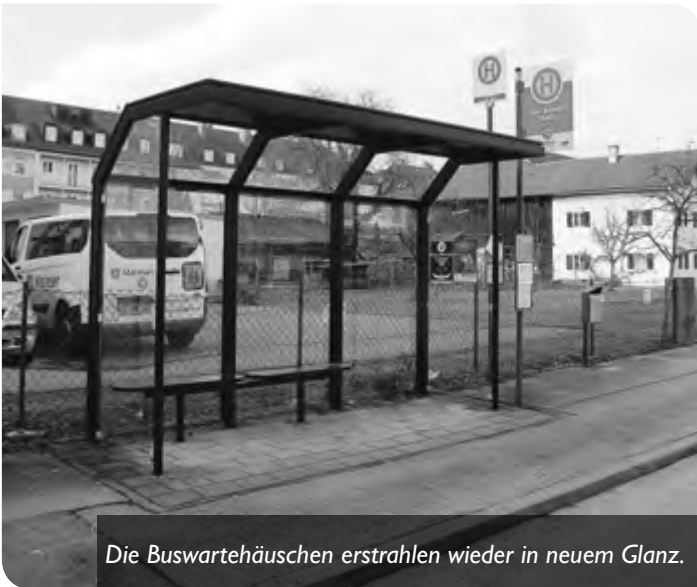
Die Buswartehäuschen erstrahlen wieder in neuem Glanz.

Seit Beginn des Stadtbusbetriebes wurden immer wieder Buswartehäuschen für die Fahrgäste zum Schutz vor Wind und Wetter errichtet. Dabei fand man im Stadtgebiet von rot, grün bis hin zu blau sämtliche Farbvarianten.