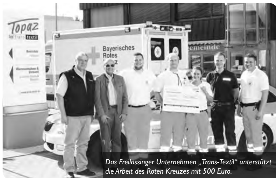
Das Freilassinger Unternehmen „Trans-Textil“ unterstützt die Arbeit des Roten Kreuzes mit 500 Euro.

Auch im Team von Trans-Textil wird das Thema Erste Hilfe großgeschrieben. So bietet der Betrieb neben der Ausbildung von Ersthelfern auch regelmäßige arbeitsplatzbezogene Schulungen für alle Mitarbeiter an. Das Managementsystem zu Arbeitssicherheit und Anlagenschutz der Trans-Textil GmbH ist aufgrund des hohen Engagements des Unternehmens seit vielen Jahren nach dem Standard OHRIS des Gewerbeaufsichtsamtes bei der Regierung von Oberbayern zertifiziert.