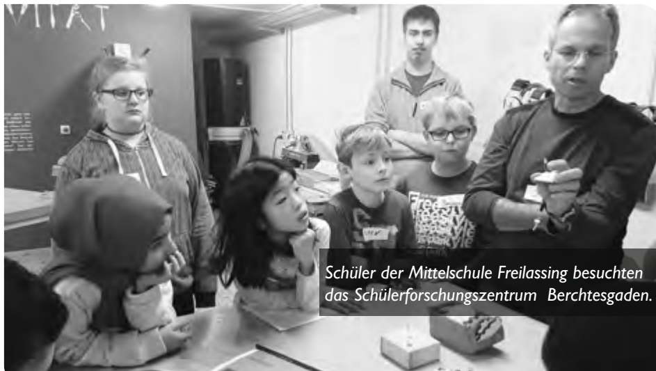
Schüler der Mittelschule Freilassing besuchten das Schülerforschungszentrum Berchtesgaden.