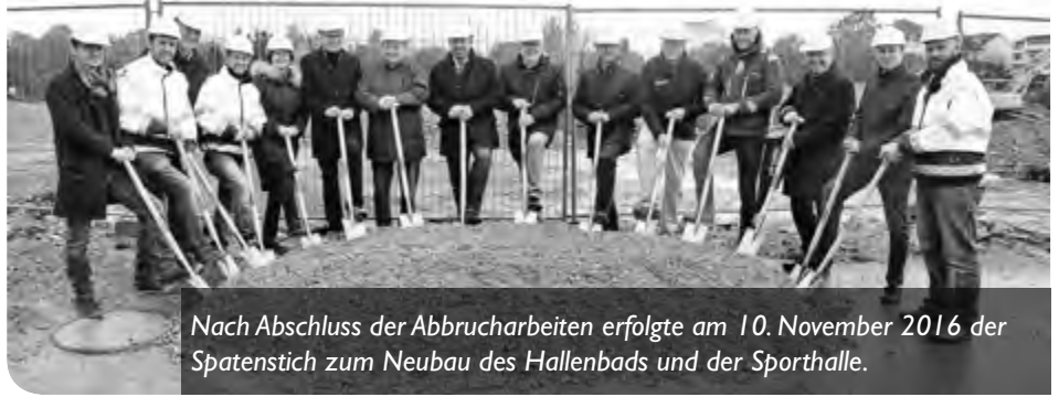
Nach Abschluss der Abbrucharbeiten erfolgte am 10. November 2016 der Spatenstich zum Neubau des Hallenbads und der Sporthalle.