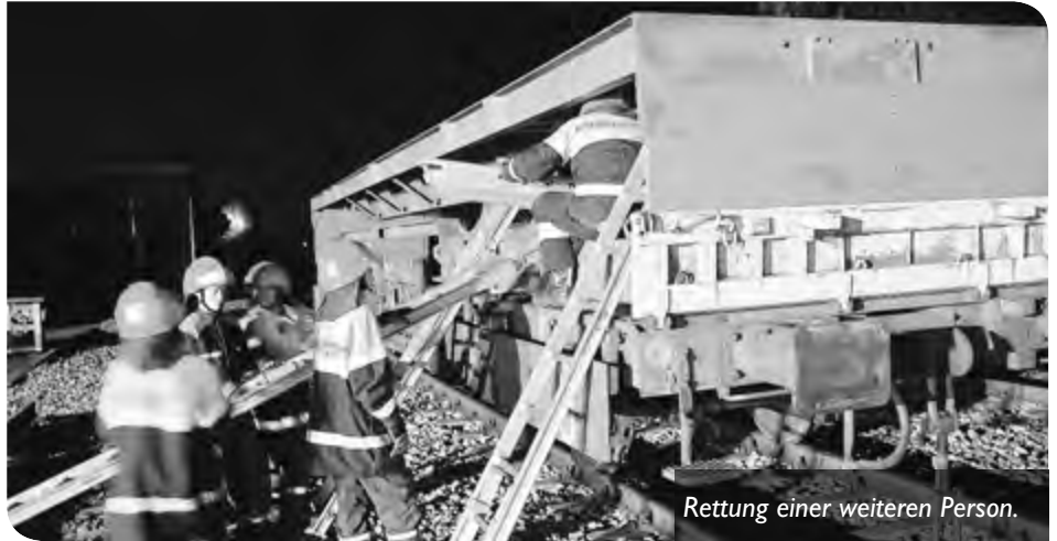
Rettung einer weiteren Person.

Nachdem Ende November sowohl für die aktive Mannschaft, wie auch für die Jugendfeuerwehr die Übungssaison nach insgesamt deutlich über 120 verschiedensten Übungen zu Ende ging, kamen am Monatsende noch einige Einsätze dazu, so dass bis Stand 01.12.2016 alles in Allem genau 200 Einsätze zu bewältigen waren. Diese reichten von Absperrungen bei Veranstaltungen und Sicherheitswachen, über Arbeitsdienste für die Stadt, z.B. Unterstützung des Bauhofs mit der Drehleiter, weiter über Ölsuren, Einsätze wegen starken Regenfällen, Sturmeinsätzen, Wohnungsöffnungen oder Personenrettungen mit der Drehleiter für den Rettungsdienst, über Fehlalarme bei Brandmeldeanlagen, Alarmierungen wegen Gasaustritten, bis hin zu Verkehrsunfällen, Brandeinsätzen mit Menschenrettung und zum wahrscheinlich dem noch allen im Gedächtnis gebliebenen Bombenfund mit großangelegter Evakuierung im Freilassinger Industriegebiet. So beendete die Freilassinger Jugendfeuerwehr ihr Jahr im November