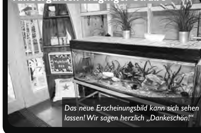
Das neue Erscheinungsbild kann sich sehen lassen! Wir sagen herzlich „Dankeschön!“

Die „Aquarienfreunde Rupertiwinkel e.V.“ haben sich dem großen Aquarium im Eingangsbereich des Kindergartens Waginger Straße angenommen. Mit Unterstützung durch das Zoofachgeschäft Ratzesberger aus Freilassing, welches eine neue Wurzel spendete, hat Vereinsmitglied Dagmar Schaub das Aquarium in neuem Glanz erscheinen lassen.