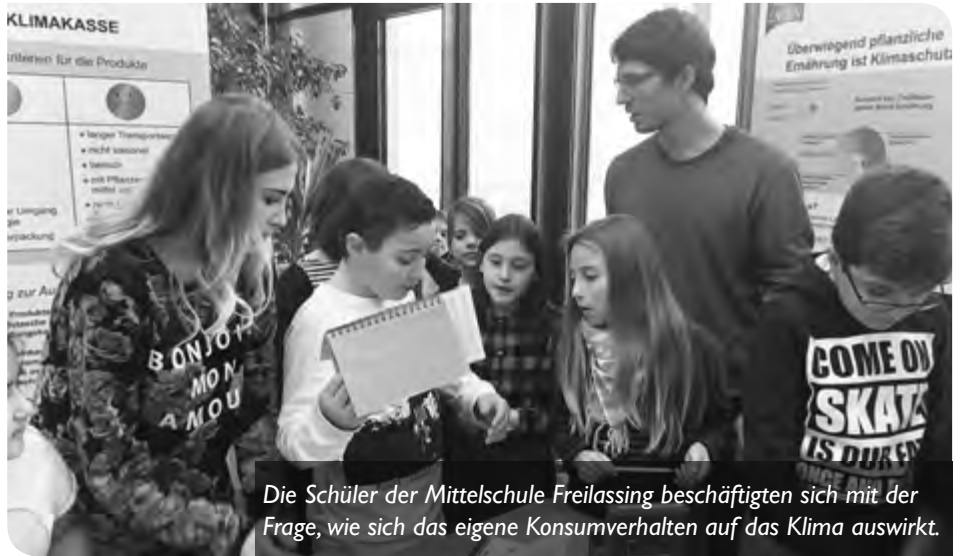
Die Schüler der Mittelschule Freilassing beschäftigten sich mit der Frage, wie sich das eigene Konsumverhalten auf das Klima auswirkt.