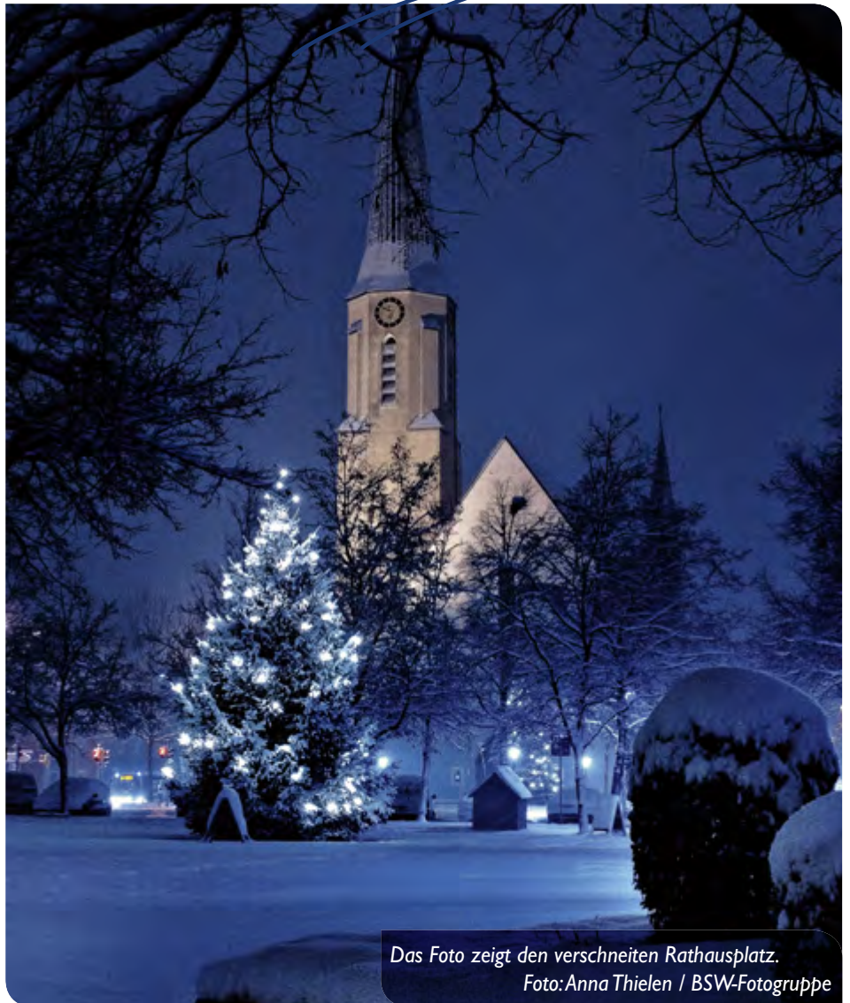
Das Foto zeigt den verschneiten Rathausplatz.